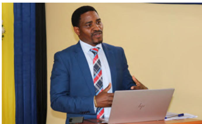
Matukio mbalimbali wakati wa Kikao Kazi cha Wadadukutoa maoni kuhusu kupitia Sheria na Kanuni zote zinazosimamia Utumishi wa Walimu kinachofanyika Mkoani Morogoro kwa siku nne kuanzia Aprili 24, 2023 katika Ukumbi wa Mikutano wa Chuo cha Ualimu Morogoro (Kigurunyembe).