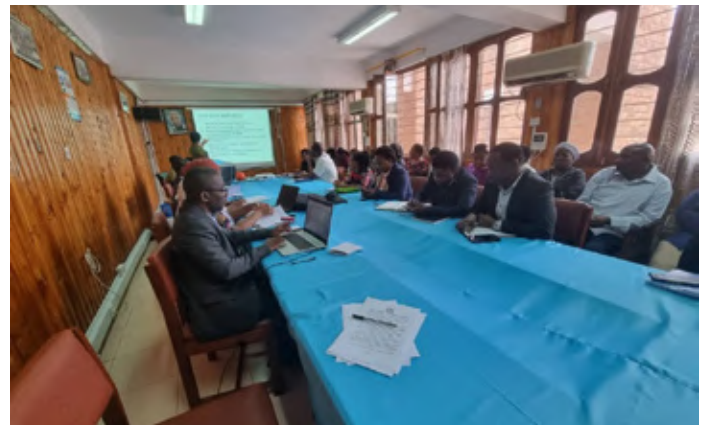
Mafunzo ya Zimamoto na Ulinzi wa Mali wakati wa majanga ya moto yakiwa yanaendelea.